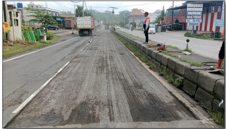
Ruas Jalan Batas Kota Batang-Batas Kab. Kendal Km. Smg 80+125-80+160 ka, 50%