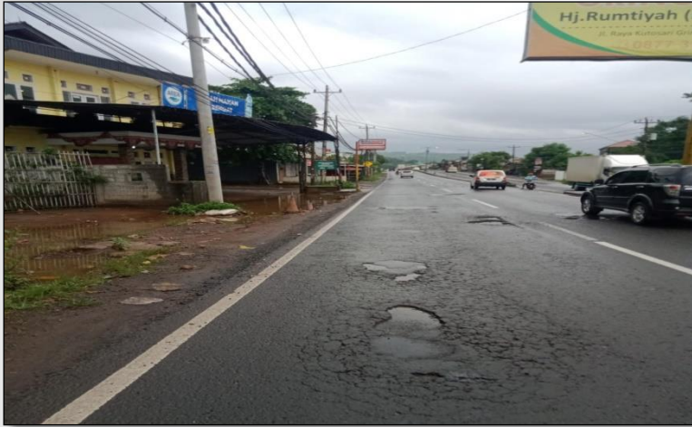
Ruas Jalan Batas Kota Batang-Batas Kab. Kendal Km. Smg 50+780 ki, 0%