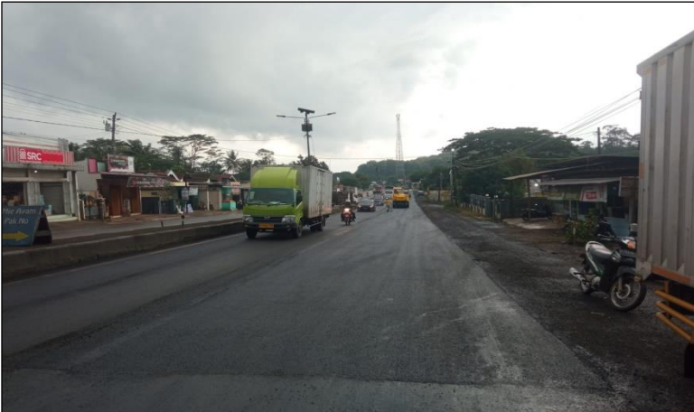
Ruas Jalan Batas Kota Batang-Batas Kab. Kendal Km. Smg 61+520-61+720 ka, 100%