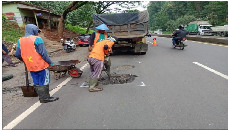
Ruas Jalan Batas Kota Batang-Batas Kab. Kendal Km. Smg 62+170 ki, 50%