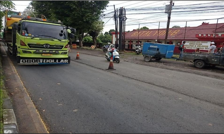
Ruas Jalan Raya Batang (Pekalongan) Km. Smg 97+100-97+500 ka, 75%