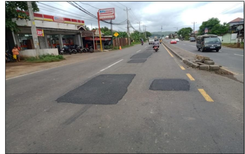
Ruas Jalan Batas Kota Batang-Batas Kab. Kendal ● Km. Smg 50+830 ki, 100%