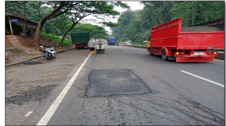
Ruas Jalan Batas Kota Batang-Batas Kab. Kendal Km. Smg 62+170 ki, 100% ●