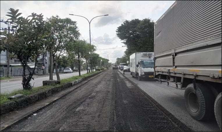
Ruas Jalan Raya Batang (Pekalongan) Km. Smg 97+100-97+500 ka, 25%