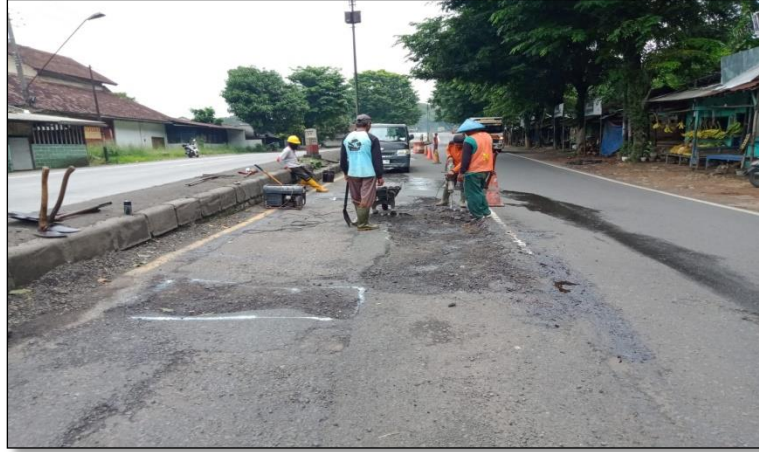
Ruas Jalan Batas Kota Batang-Batas Kab. Kendal Km. Smg 59+980 ka, 50%