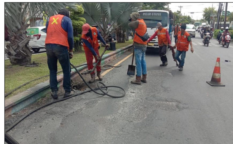
Ruas Jalan Merdeka (Pekalongan) Km. Smg 101+600 ka, 50%