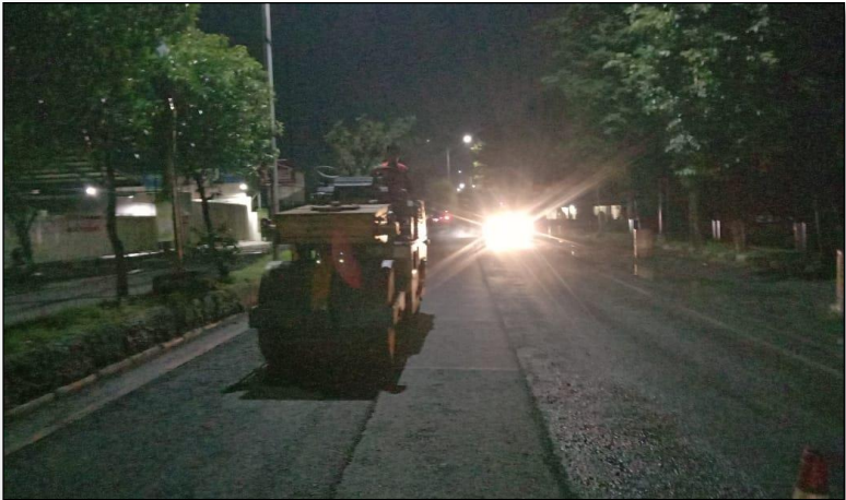
Ruas Jalan Raya Batang (Pekalongan) Km. Smg 97+100-97+500 ka, 50%