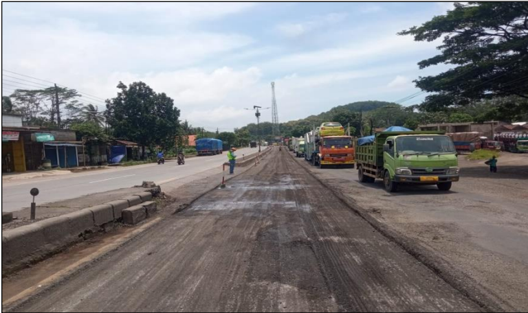
Ruas Jalan Batas Kota Batang-Batas Kab. Kendal Km. Smg 61+520-61+720 ka, 50%