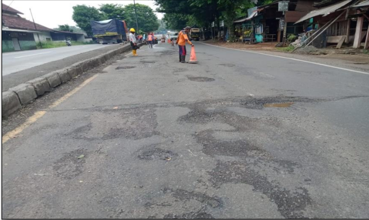
Ruas Jalan Batas Kota Batang-Batas Kab. Kendal Km. Smg 59+980 ka, 0%