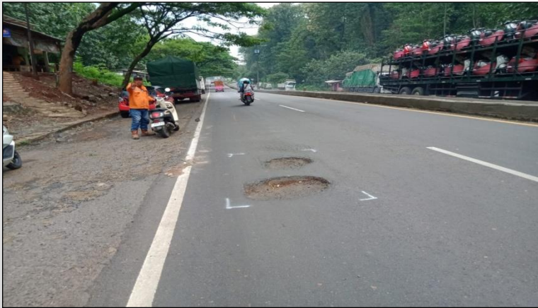
Ruas Jalan Batas Kota Batang-Batas Kab. Kendal ● Km. Smg 62+170 ki, 0%