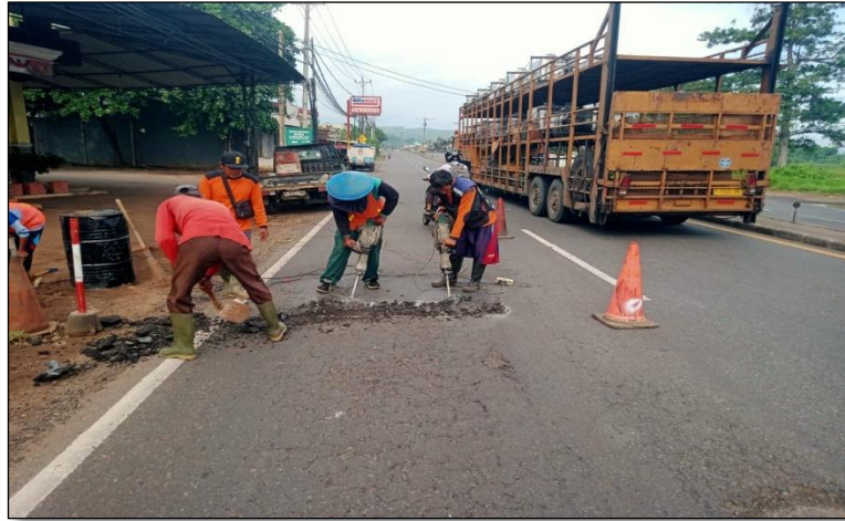
Ruas Jalan Batas Kota Batang-Batas Kab. Kendal Km. Smg 50+780 ki, 50%