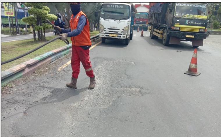
Ruas Jalan Merdeka (Pekalongan) ● Km. Smg 101+600 ka, 0%