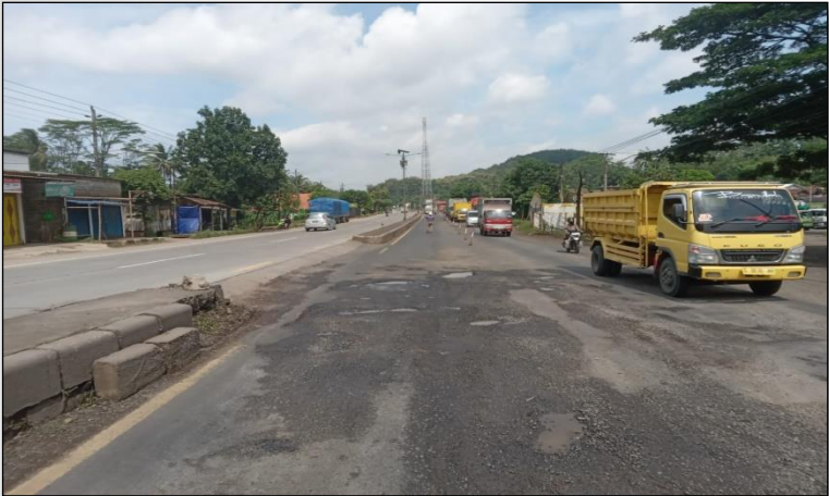
Ruas Jalan Batas Kota Batang-Batas Kab. Kendal Km. Smg 61+520-61+720 ka, 0%