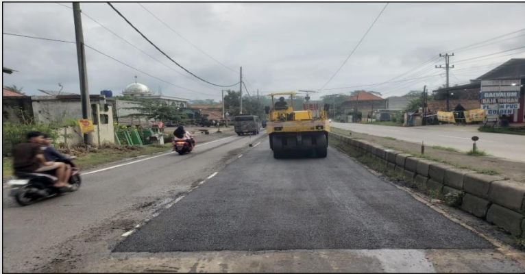
Ruas Jalan Batas Kota Batang-Batas Kab. Kendal ● Km. Smg 80+125-80+160 ka, 75%