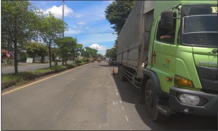
Ruas Jalan Raya Batang (Pekalongan) Km. Smg 97+100-97+500 ka, 0%