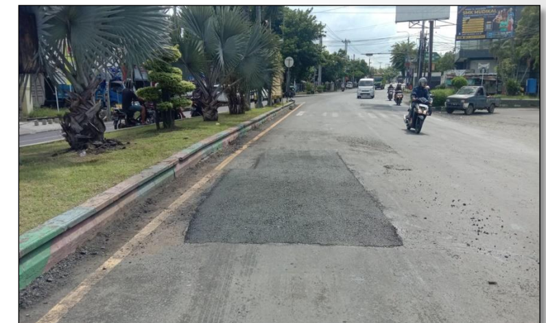
Ruas Jalan Merdeka (Pekalongan) ● Km. Smg 101+600 ka, 100%