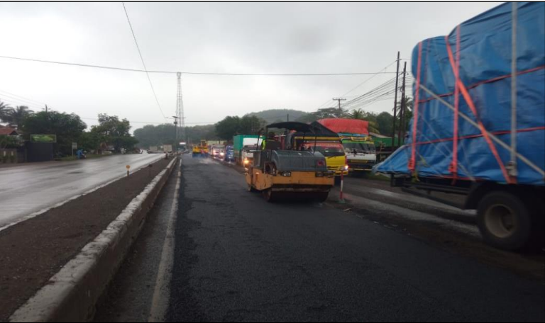
Ruas Jalan Batas Kota Batang-Batas Kab. Kendal ● Km. Smg 61+520-61+720 ka, 75%