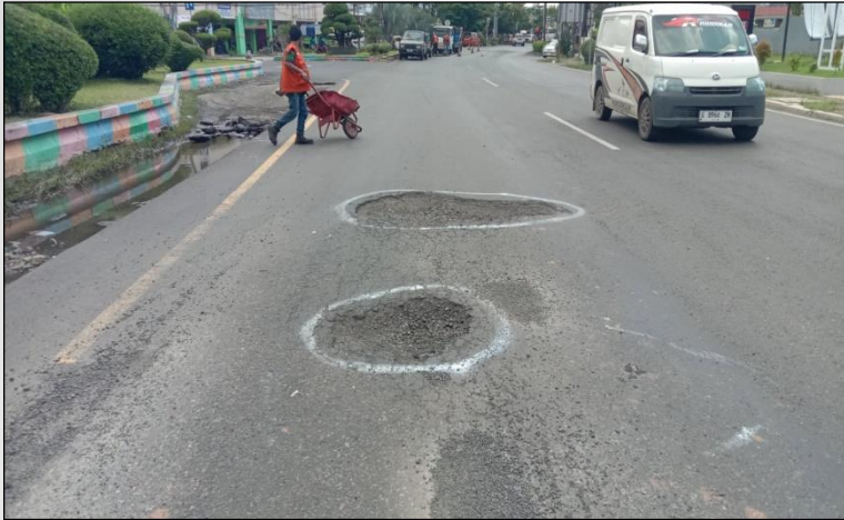
Ruas Jalan Merdeka (Pekalongan) Km. Smg 101+525 ka, 0%