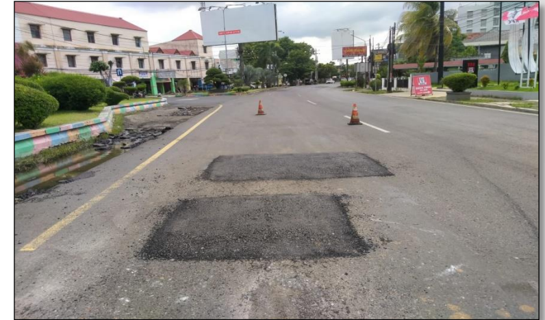
Ruas Jalan Merdeka (Pekalongan) Km. Smg 101+525 ka, 100%