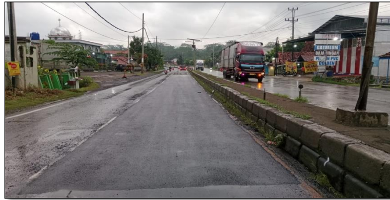
Ruas Jalan Batas Kota Batang-Batas Kab. Kendal Km. Smg 80+125-80+160 ka, 100%