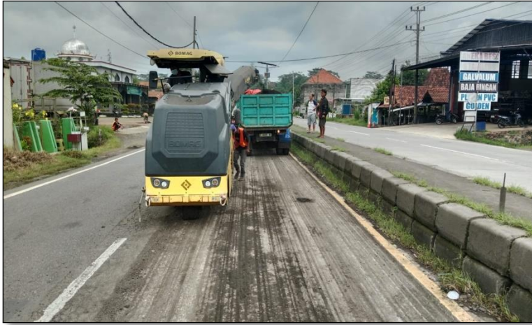
Ruas Jalan Batas Kota Batang-Batas Kab. Kendal Km. Smg 80+125-80+160 ka, 25%