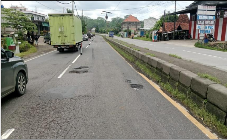
Ruas Jalan Batas Kota Batang-Batas Kab. Kendal Km. Smg 80+125-80+160 ka, 0%