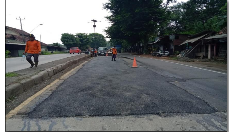
Ruas Jalan Batas Kota Batang-Batas Kab. Kendal Km. Smg 50+780 ka, 100%