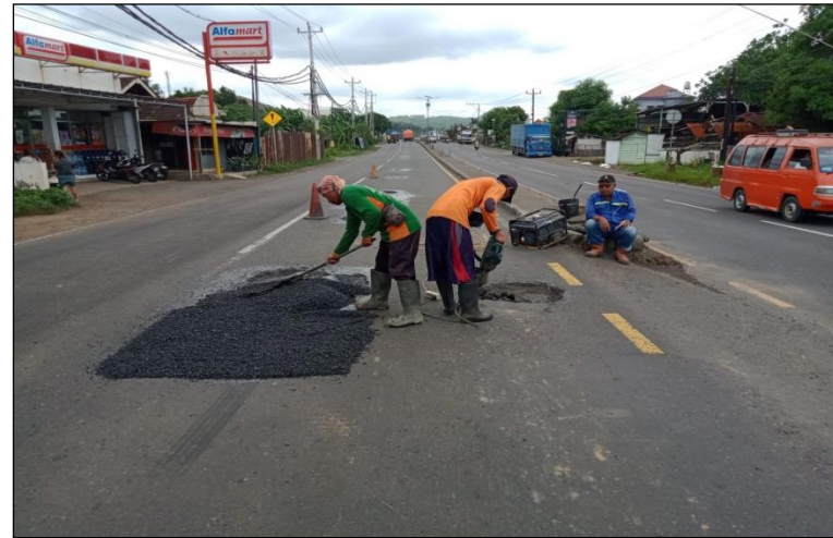
Ruas Jalan Batas Kota Batang-Batas Kab. Kendal Km. Smg 50+830 ki, 50%