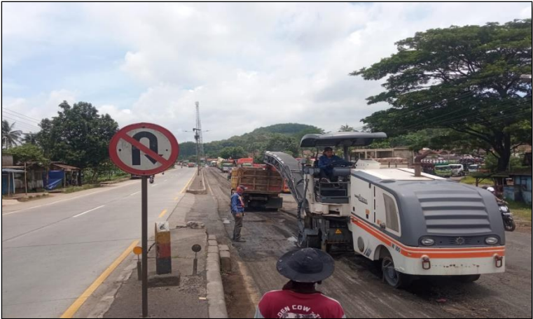
Ruas Jalan Batas Kota Batang-Batas Kab. Kendal Km. Smg 61+520-61+720 ka, 25%