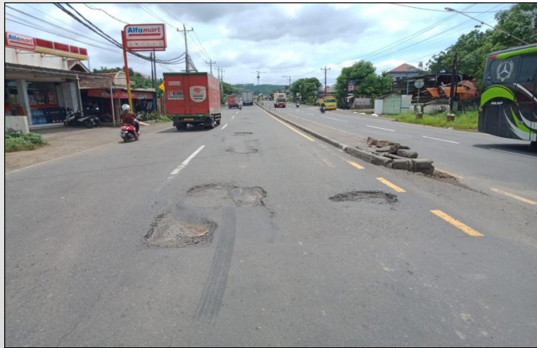
Ruas Jalan Batas Kota Batang-Batas Kab. Kendal ● Km. Smg 50+830 ki, 0%