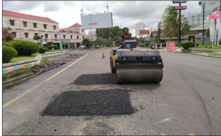
Ruas Jalan Merdeka (Pekalongan) Km. Smg 101+525 ka, 50%