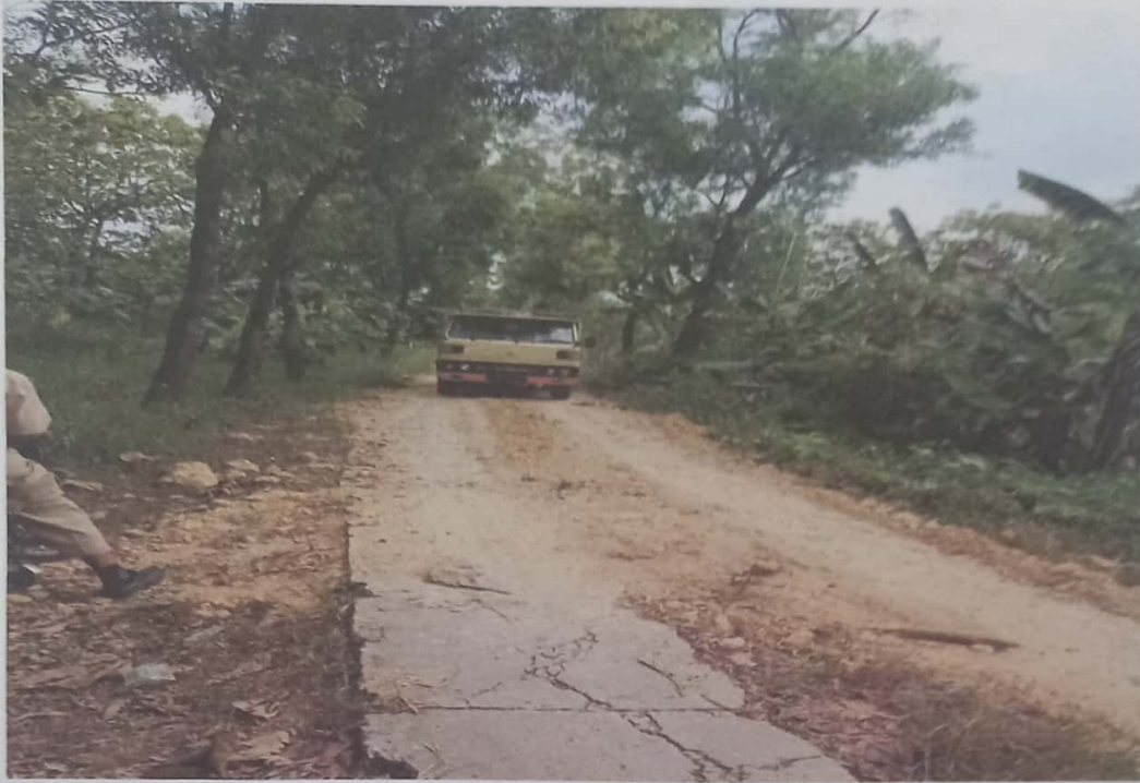
Jalan dilalui Kendaraan Roda empat dengan muatan berat