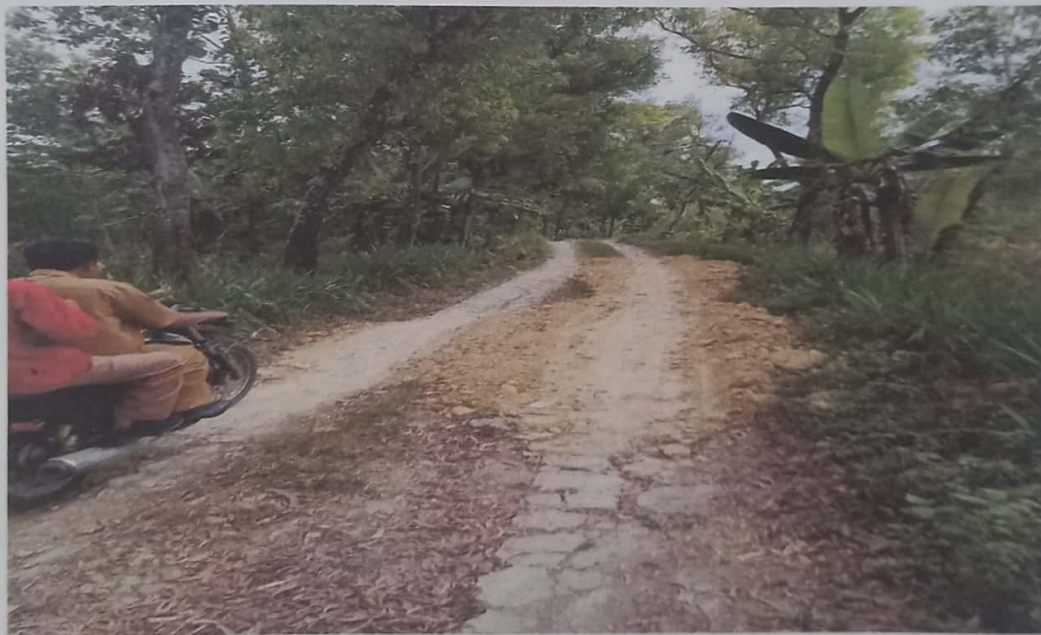
Telah dilakukan perbaikan jalan dengan pengurukan tanah