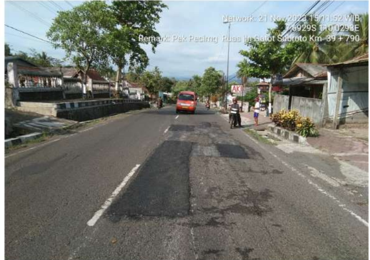
Pekerjaan Penambalan Jalan Jl. Jend. Gatot Subroto (Purworejo) Ruas 165.13.K Km.Mgl.39+790