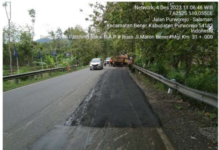
Pekerjaan Penambalan Jalan Bts. Kab. Purworejo/ Bener - Maron Ruas 169 Km.Mgl.31+000