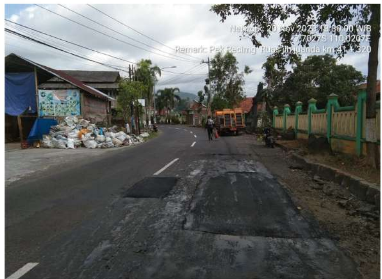
Pekerjaan Penambalan Lubang Jl. Ir. H. Juanda (Purworejo) Ruas 165.13.K Km.Mgl.41+320