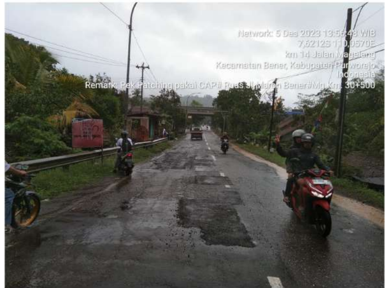
Pekerjaan Penambalan Lubang Bts. Kab. Purworejo/ Bener - Maron Ruas 169 Km.Mgl.30+500