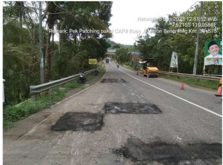
Pekerjaan Penambalan Lubang Bts. Kab. Purworejo/ Bener - Maron Ruas 169 Km.Mgl.30+575