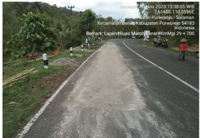
Pekerjaan Penambalan Jalan (Lapen) Bts. Kab. Purworejo/ Bener - Maron Ruas 169 Km.Mgl.29+700