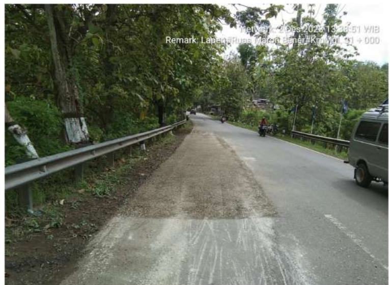
Pekerjaan Penambalan Jalan (Lapen) Bts. Kab. Purworejo/ Bener - Maron Ruas 169 Km.Mgl.31+000