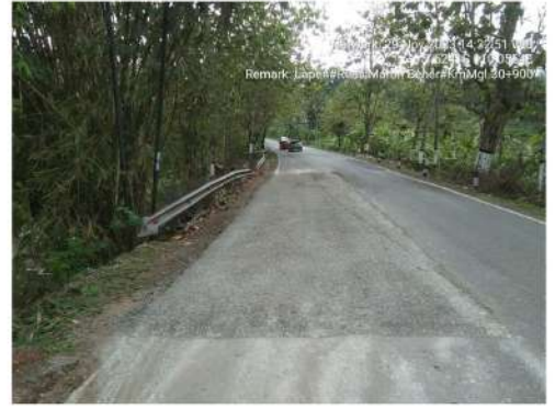
Pekerjaan Penambalan Jalan (Lapen) Bts. Kab. Purworejo/ Bener - Maron Ruas 169 Km.Mgl.30+900