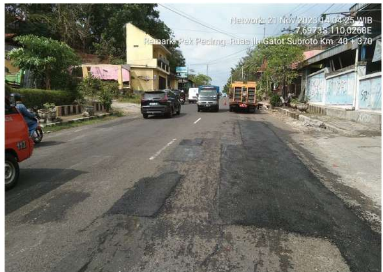
Pekerjaan Penambalan Jalan Jl. Jend. Gatot Subroto (Purworejo) Ruas 165.13.K Km.Mgl.40+370