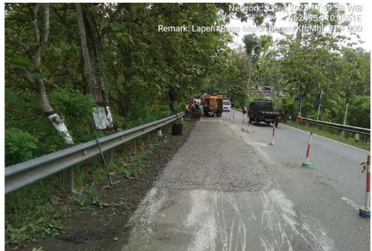
Pekerjaan Penambalan Jalan (Lapen) Bts. Kab. Purworejo/ Bener - Maron Ruas 169 Km.Mgl.31+000