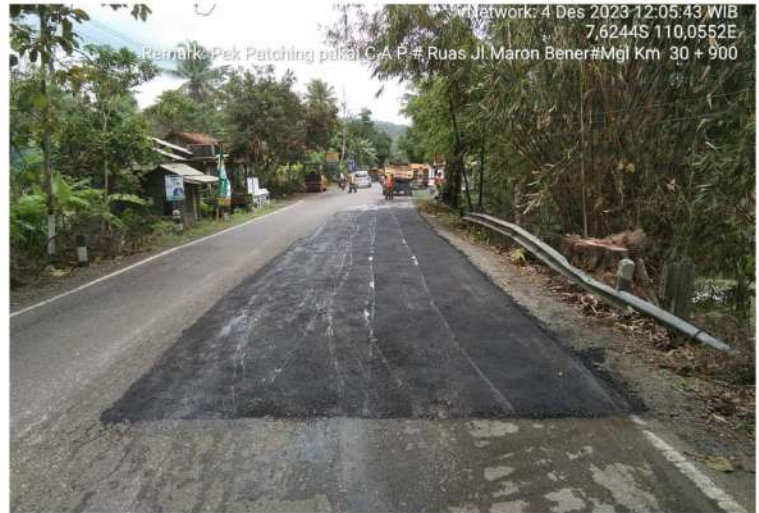
Pekerjaan Penambalan Jalan Bts. Kab. Purworejo/ Bener - Maron Ruas 169 Km.Mgl.30+900