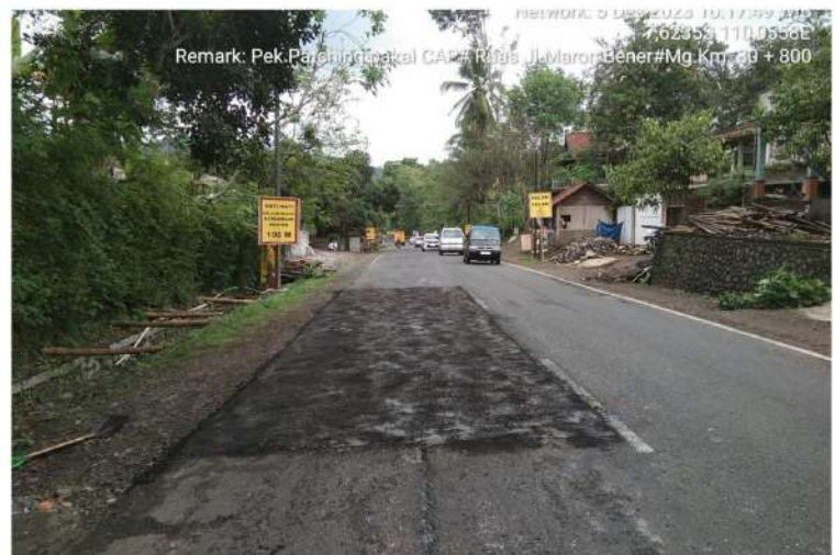
Pekerjaan Penambalan Lubang Bts. Kab. Purworejo/ Bener - Maron Ruas 169 Km.Mgl.30+700