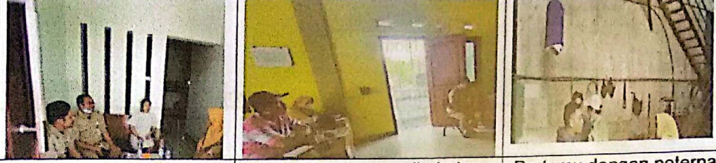
Bertemu dengan Pengadu Koordinasi dengan pihak desa Bertemu dengan peternak Verifikasi Aduan Tanggal 21 Agustus 2023