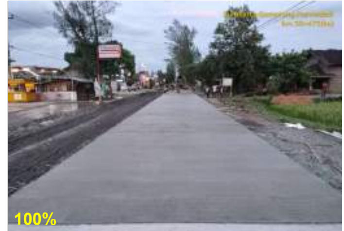
Pekerjaan Perkerasan Beton FS45 Ruas Surakarta - Gemolong (Sragen) - Purwodadi Km. 30+475 kanan