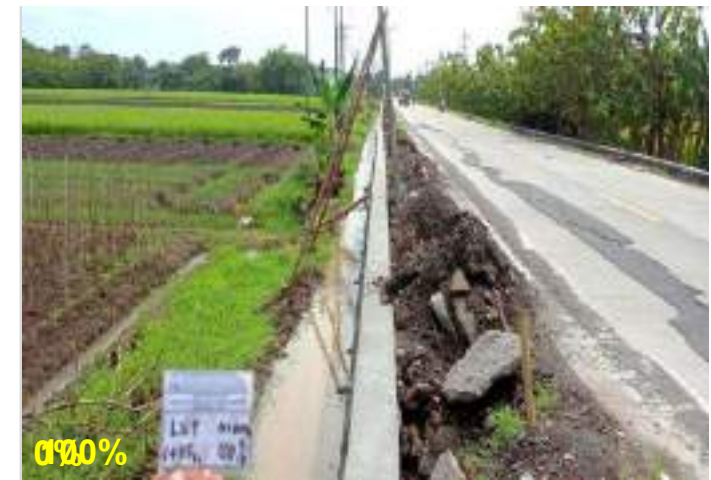
Pekerjaan Pasangan Batu Ruas Lingkak Utara Timur (Sragen) Sta. 1+115 kiri