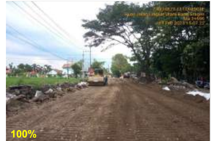
Pekerjaan Timbunan Pilihan Ruas Lingkaran Utara Barat (Sragen) Sta. 3+500 - 3+600