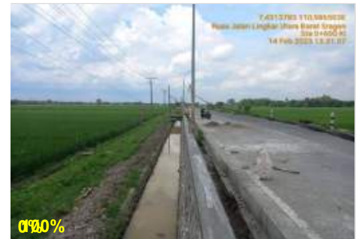
Pekerjaan Pasangan Batu Ruas Lingkaran Utara Barat (Sragen) Sta. 0+500 - 0+600 kiri