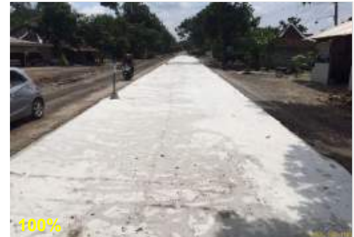
Pekerjaan Perkerasan Beton FS45 Ruas Surakarta - Gemolong (Sragen) - Purwodadi Km. 34+120 kanan