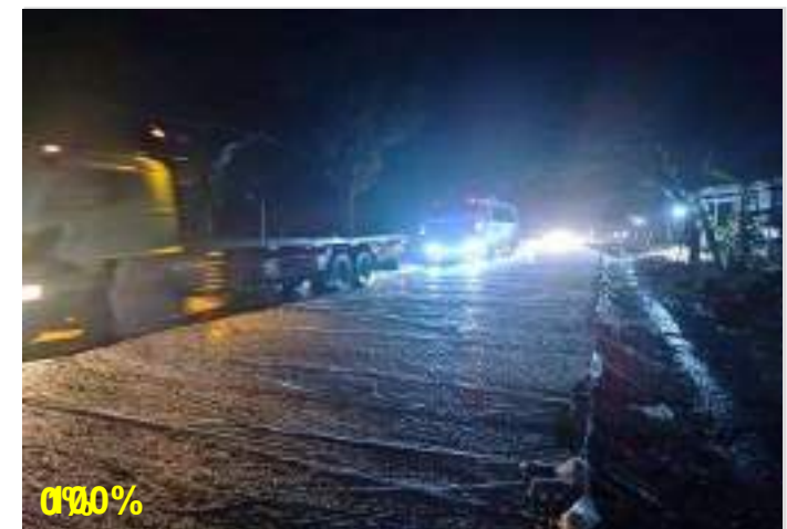
Pekerjaan Perkerasan Beton FS45 Ruas Surakarta - Gemolong (Sragen) - Purwodadi Km. 33+825 kanan