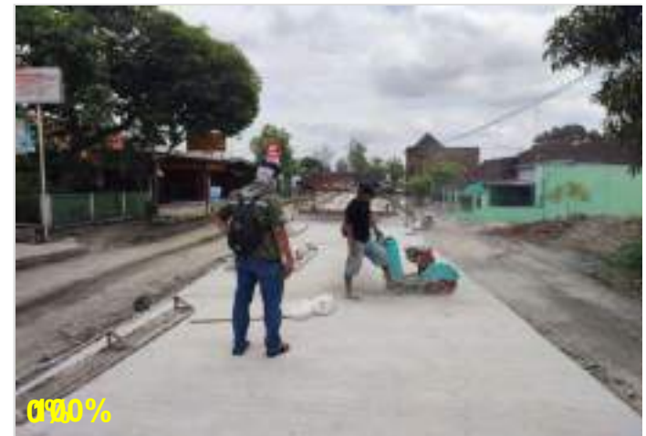
Pekerjaan Perkerasan Beton FS45 Ruas Surakarta - Gemolong (Sragen) - Purwodadi Km. 30+350 kanan