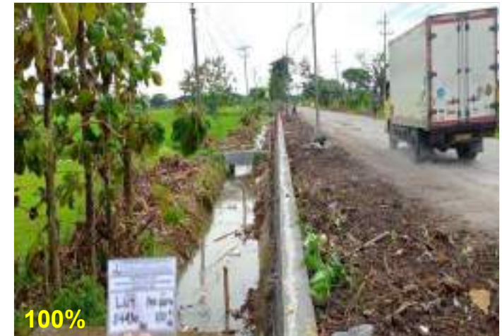
Pekerjaan Pasangan Batu Ruas Lingkak Utara Timur (Sragen) Sta. 0+430 kiri