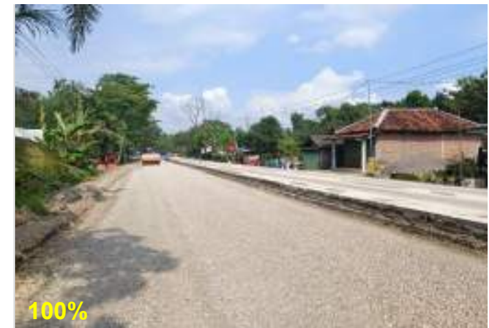
Pekerjaan Penghamparan dan Pemasatan Agregat Klas A Ruas Surakarta - Gemolong (Sragen) - Purwodadi Km. 33+850 sd 34+050 kiri