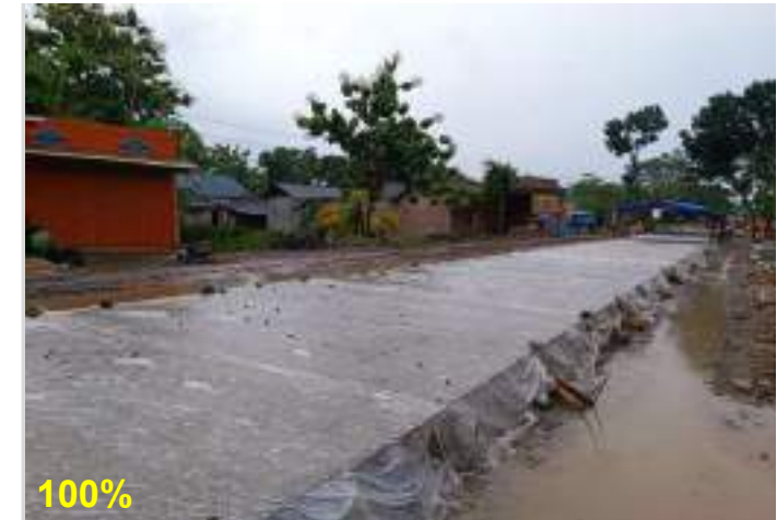
Pekerjaan Perkerasan Beton FS45 Ruas Surakarta - Gemolong (Sragen) - Purwodadi Km. 33+720 kanan