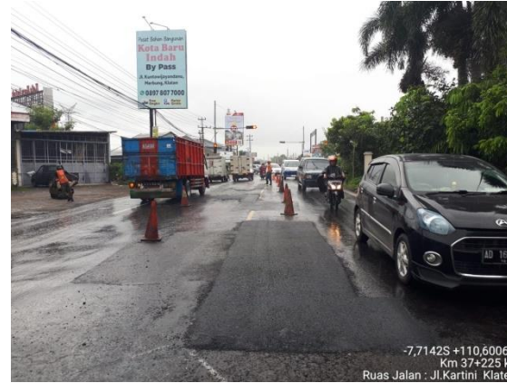
PENANGANAN LUBANG JLN. KARTINI (KLATEN) KM. 37+225 KA