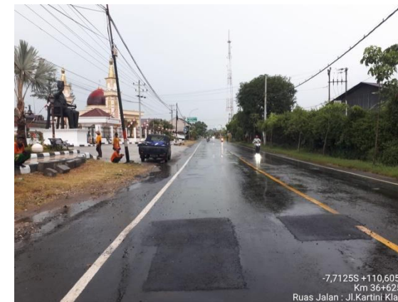
PENANGANAN LUBANG JLN. KARTINI (KLATEN) KM. 36+625 KA