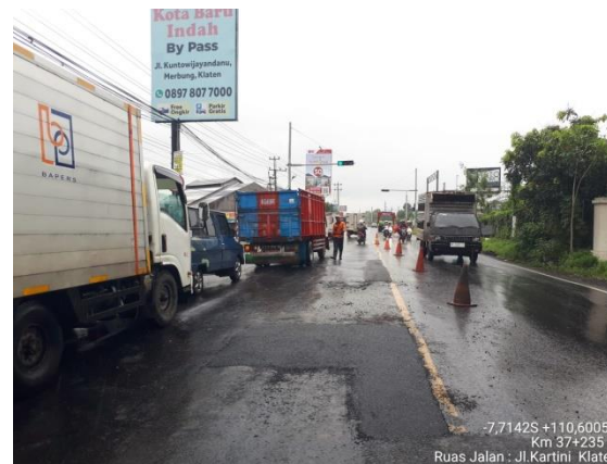
PENANGANAN LUBANG JLN. KARTINI (KLATEN) KM. 37+235 KA