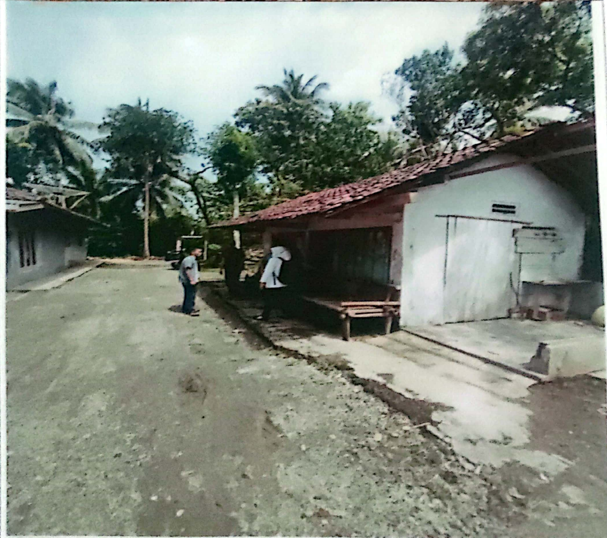
TIM KECAMATAN SURVEY KE LOKASI BERSAMA KETUA RT, KASI, KADUS DAN KADES YANG MANA TANAH TERSEBUT MERUPAKAN TANAH MILIK WARGA, BUKAN TANAH DESA SEHINGGA BUKAN MENJADI KEWENANGAN DESA.