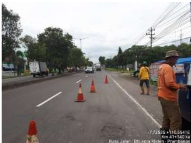
PENANGANAN LUBANG BTS KOTA KLATEN-PRAMBANAN KM. 41+355 KA

7.72535 +110.5541E Km 41+340 ka Ruas Jalan : Bts kota Klaten - Prambanan