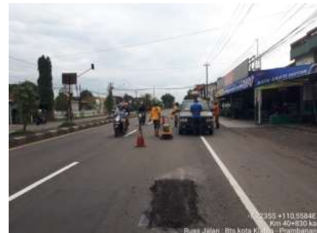
PENANGANAN LUBANG BTS KOTA KLATEN-PRAMBANAN KM. 40+830 KA