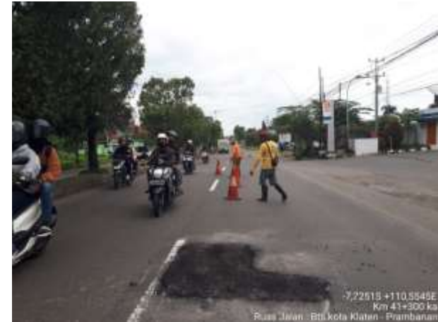
PENANGANAN LUBANG BTS KOTA KLATEN-PRAMBANAN KM. 41+300 KA