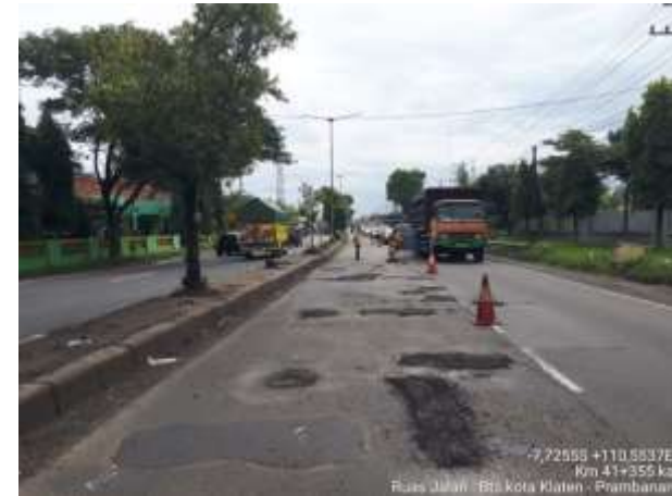
PENANGANAN LUBANG BTS KOTA KLATEN-PRAMBANAN KM. 41+355 KA