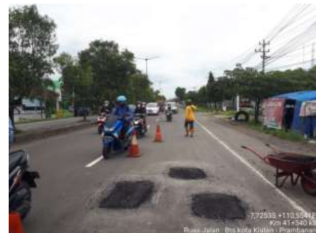
PENANGANAN LUBANG BTS KOTA KLATEN-PRAMBANAN KM. 41+340 KA