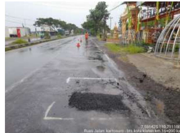
PENANGANAN LUBANG KARTOSURO-BTS KOTA KLATEN KM. 16+090 KA