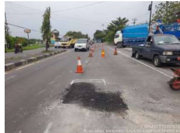
PENANGANAN LUBANG KARTOSURO-BTS KOTA KLATEN KM. 16+660 KA