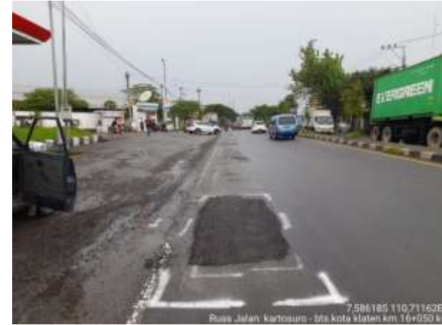
PENANGANAN LUBANG KARTOSURO-BTS KOTA KLATEN KM. 16+050 KI