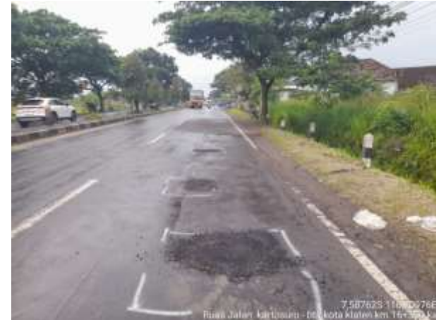
PENANGANAN LUBANG KARTOSURO-BTS KOTA KLATEN KM. 16+300 KA